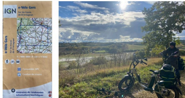
Ils ont testé la partie Gers de la route européenne d'Artagnan!

Premier itinéraire de randonnée équestre européen, la Route Européenne d'Artagnan relie Lupiac a qui a vu naître le héros légendaire, à Maastricht aux Pays-Bas, lieu de sa mort.