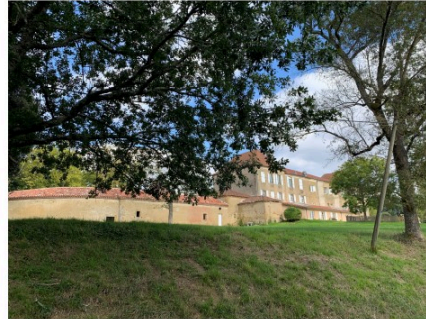
Randonnée à Mondebat avec les Randonneurs des Castelnaux de Bazian

Dimanche 10 octobre 2021 a eu lieu la randonnée au village de Mondébat.