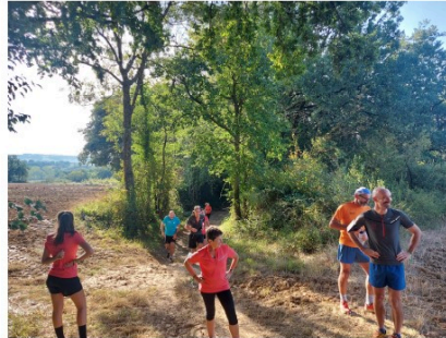
Rappel: courir pour les gentlemen, c'est dimanche !

Les Galopins du Fezensac organisent le dimanche 28 novembre à partir de 9 h30 deux courses de 7 et 11 km et une randonnée de 7 km au départ du gymnase du collège.