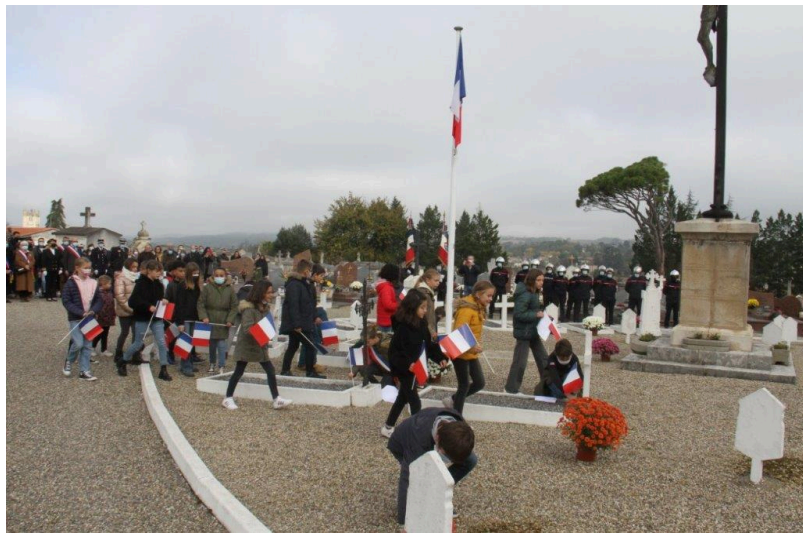
Dernières minutes de recueillement...