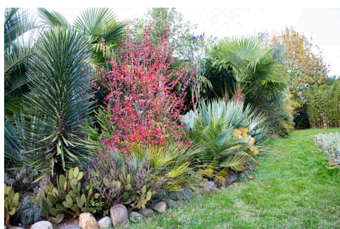
Au détour du sentier