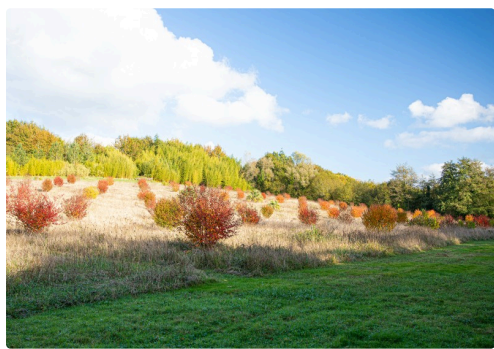
Vue générale du parc de lagerstroemias