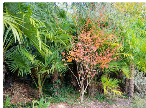
Autre lagerstroemia hors du parc