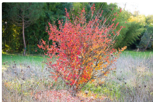
Lagerstroemia près d'une pièce d'eau