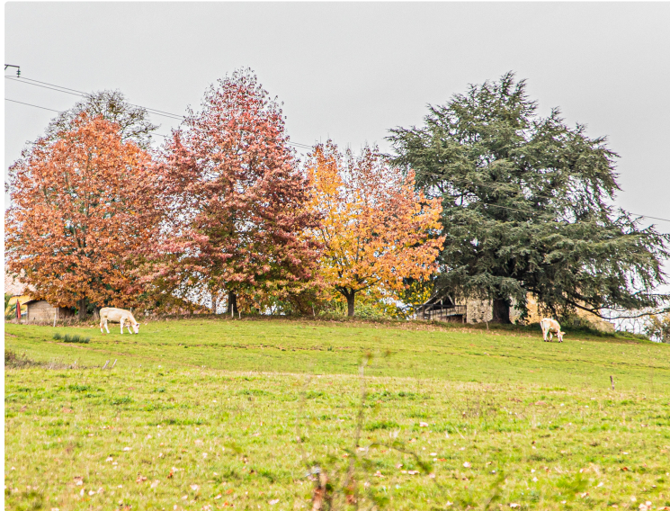
Couleurs d'automne autour de Nogaro et d'Aignan

Ce petit album n'a d'autre but que d'attirer l'attention sur la beauté de la nature en automne dans nos régions : il n'y a pas que l'automne au Canada qui mérite l'admiration !