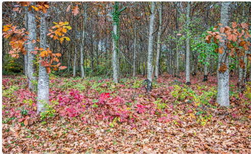
Chênes à Sorbets