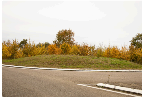
Rond-point près de Nogaro