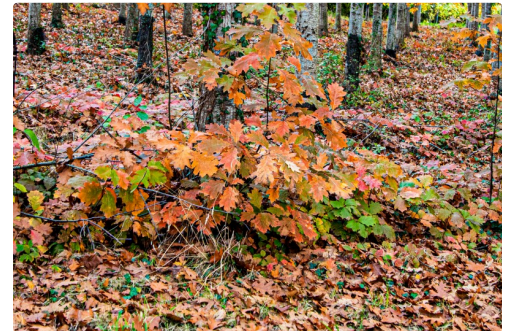
Chênes à Sorbets