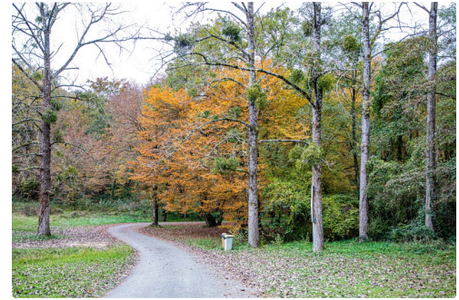
Au détour d'un chemin