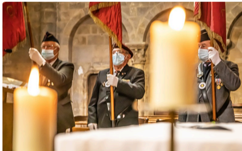
Les porte-drapeaux sont en place