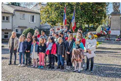
Des enfants de l'école chantent la Marseillaise