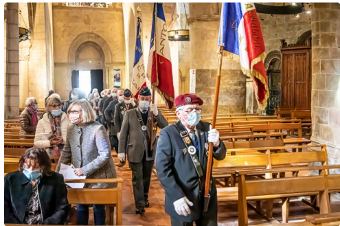
Arrivée des anciens combattants à l'église

« La flamme des compagnons s'est éteinte, mais nous sommes les dépositaires de ses braises ardentes. Entretien-les sans cesse, ravivons-les inlassablement, en honorant ceux qui donnent leur vie pour la France, ceux qui la servent avec dévouement et courage. »