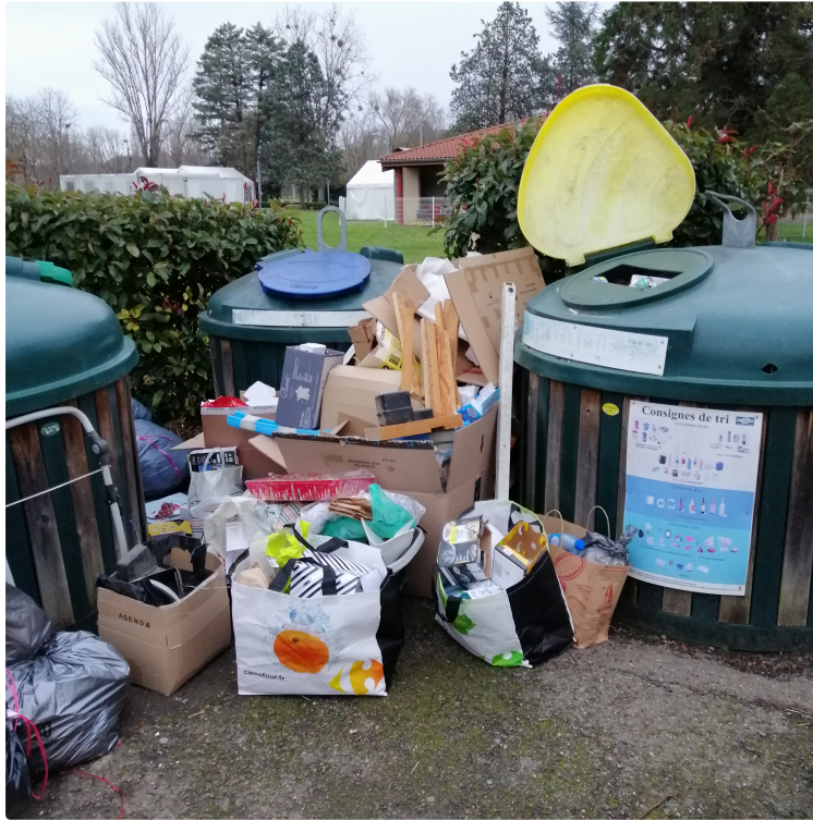
Incivisme quand tu nous tiens...

Dans le bulletin municipal qui est en cours de distribution, une page est consacrée au rappel des sanctions en cas d'incivilités.