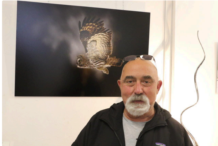
De retour de chez lui, en Finlande