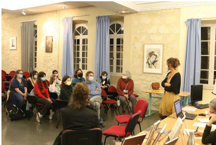
Une assemblée générale pour découvrir Art' Boss

L'association du Lycée Bossuet pour ouvrir les élèves au monde de l'art