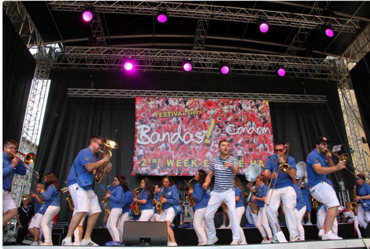
Fins prêts pour 2022 et la prochaine édition du Festival de Bandas !

Tout savoir ou presque sur les 13, 14 et 15 mai prochains grâce à l'assemblée générale de l'association du festival.