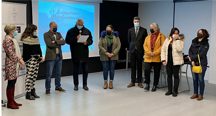
44 ordinateurs pour les élèves de 6ème du collège de Plaisance

Une expérimentation du conseil départemental