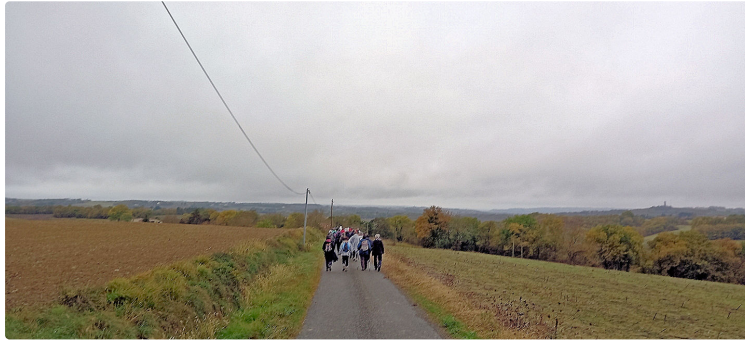
Une halte au Domaine de Polignac pour les Randonneurs de Lagardère

Dimanche 14 novembre, reçus par la famille Gratian dans leur domaine de Polignac, les randonneurs des coteaux de Lagardère étaient présents accompagnés de participants venant de plusieurs clubs du département.