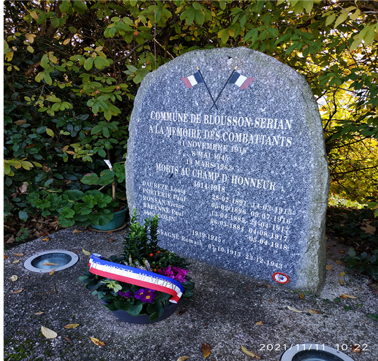
14/18 sur les traces d'enfants du pays devenus avec le temps presque anonymes