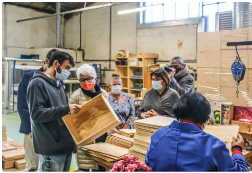
Fabrication de caisses