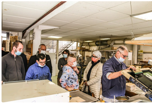
Atelier de sérigraphie