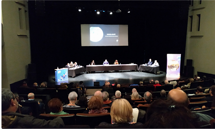
Assemblée générale Jazz In Marciac