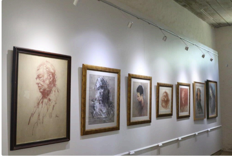
Le mois de décembre à l'Abbaye de Flaran

→ Dimanche 5 décembre, à 15 h 30 : Découvrez la collection Simonow autrement avec les contes "Fée moi signe"