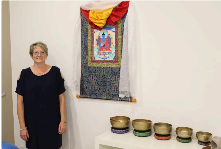
Partir du bon pied

Les pieds sont l'une des parties du corps les plus exposées. En portant tout le corps, ils subissent diverses pressions et peuvent souffrir de différents troubles. Le pédicure-podologue est un professionnel de santé. Pour exercer ce métier, le diplôme d'État (DE) est obligatoire. Après un bac scientifique de préférence, ce diplôme se prépare en trois années dans un institut de formation en pédicure-podologie.