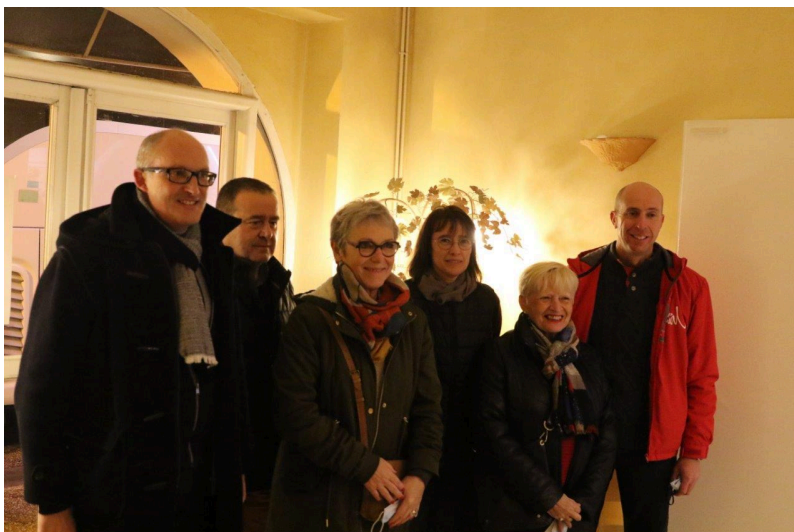
Le moment choisi par le maire pour remercier les participants à cette randonnée nocturne à travers la ville.