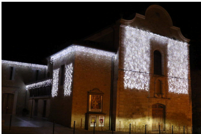
La nouveauté de l'année : l'embellissement du Théâtre des Carmes