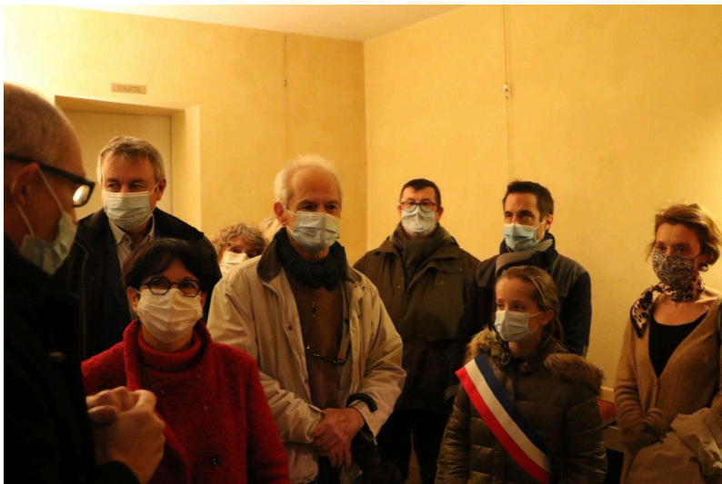
Une pause en bord de Baise au Continental pour les officiels.