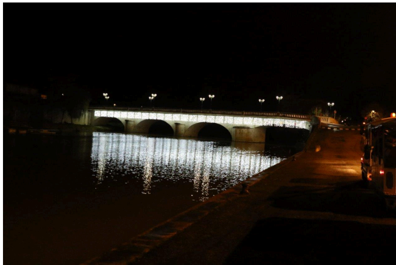
Pour la deuxième année consécutive, la Baïse s'éclaire grâce aux illuminations installées sur les côtés du pont Barlet.