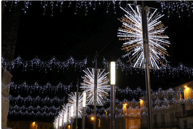
La féerie de Noël peut redémarrer

Condom : vendredi 3 décembre, le jour se couche officiellement à 17 h 21. Une heure plus tard, à 18 h 30, la nuit est tombée sur la ville. L'heure est propice pour allumer officiellement les lumières de Noël.