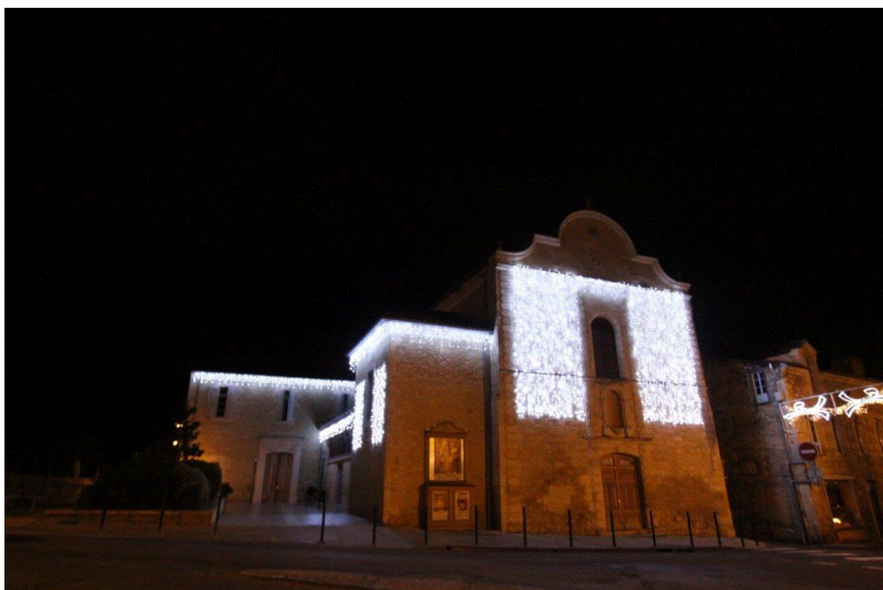
Il est si beau dans ces nouveaux atours ! Notre photographe, Marc Le Saux, n'a pas pu résister à lui tirer le portrait à plusieurs reprises. Quel dilemme alors pour choisir un cliché parmi tant d'autres !