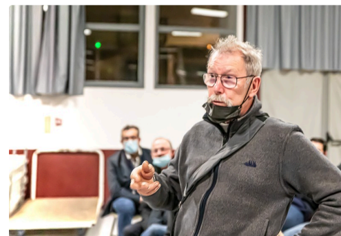
Question sur les forêts