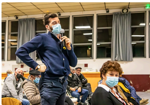
Question d'un mélanchoniste