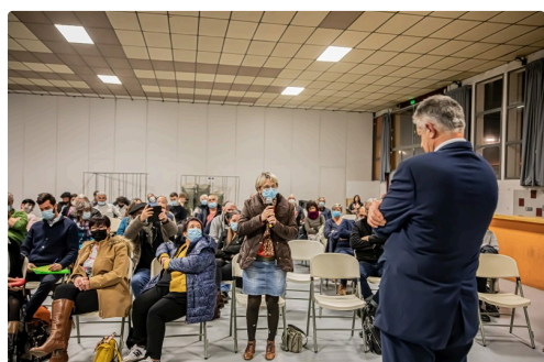
Question sur les infirmières