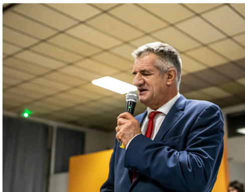
Jean Lassalle lors de sa conférence