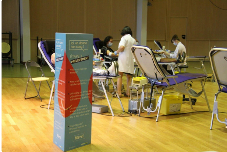
Encore un bon geste avant la fin de l'année !

Dernière collecte de sang dans la commune pour 2021