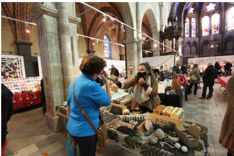
De l'artisanat d'art, mais aussi des associations caritatives, comme La Croix-Rouge française, par exemple.