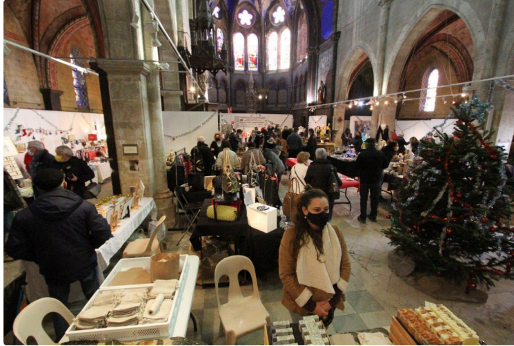
Encore un jour pour profiter du marché de Noël à l'Espace Saint-Michel

Un des projets de l'actuelle municipalité est de rebooster les comités de quartier mis en place il y a tout juste une dizaine d'années sous la mandature de Bernard Gallardo. Huit comités avaient été alors constitués pour transmettre des propositions auprès de la municipalité dans des domaines liés à l'urbanisme, l'éclairage public, la voirie, le fleurissement, la circulation et le stationnement, mais aussi la sécurité et surtout l'animation. Pour ce dernier point, le comité de quartier n°4 n'avait pas perdu de temps puisqu'il avait rapidement créé ce marché de Noël qui a su séduire son public avec une fréquentation qui ne se dément pas.