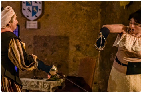
Règlement de comptes entre dames