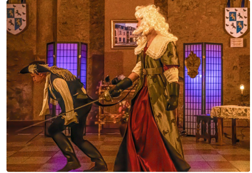
Il a osé défier le fameux chevalier d'Eon