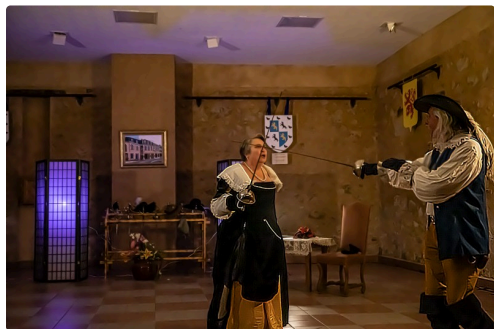
Scène de ménage qui tourne au duel

Voir l'article sur les autres animations du marché de Noël ( https://lejournaldugers.fr/article/53965-lupiac-le-marche-de-noel-a-ete-loccasion-de-nombreuses-festivites ).