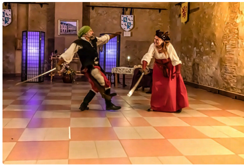
Capitaine contre pirate