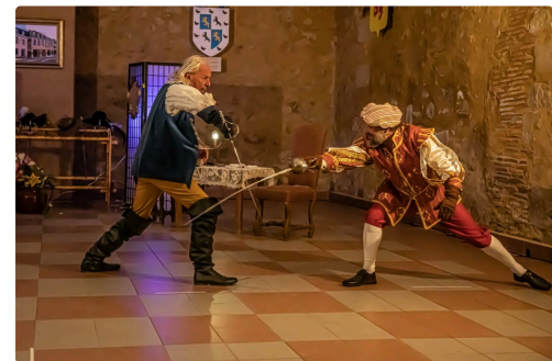
Ils règlent la querelle