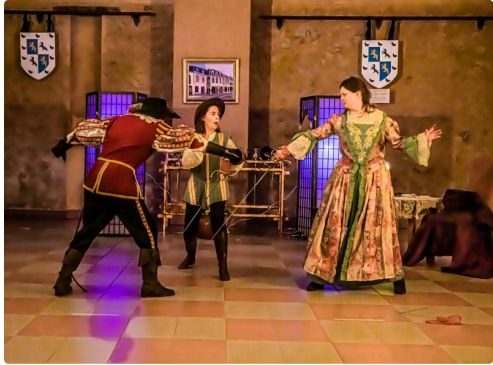
Le duel reprend