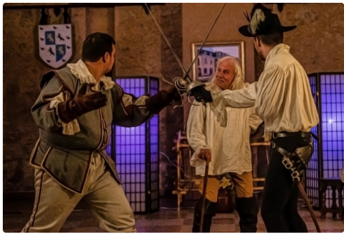
Les frères se disputent l'héritage, le père arrive