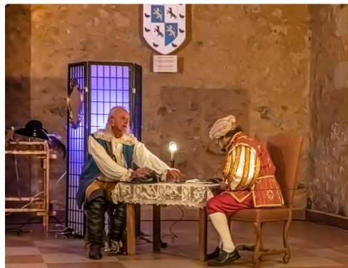
Les joueurs se querellent