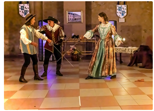
Un homme remplace la débutante