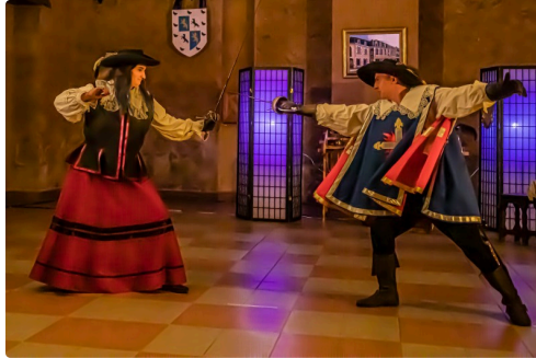
La femme mousquetaire s'impose