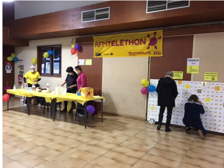
Téléthon 2021 : des dons en progression !

Le 12 septembre dernier , les Associations pour le Téléthon, le C.O.S.A.C.A., la Gym Volontaire Vicoise, 1,2,3, Gym, les Galopins du Fezensac, la Pédales Castillonnaise, les Pitchoun's se sont mobilisées en faveur du Téléthon.