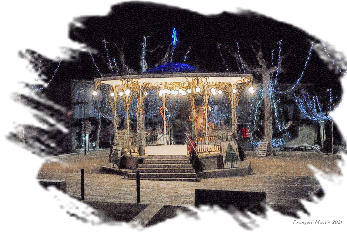
L'Informe à Tics et le Père-Noël