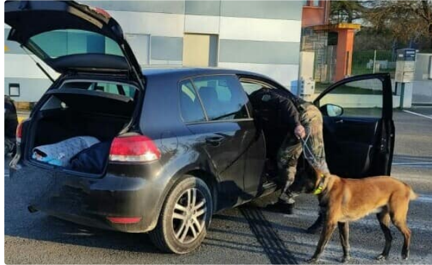
Alcool et stupéfiant la gendarmerie veille

La semaine passée, les militaires de la Communauté de Brigades de L'Isle-Jourdain ont procédé à un contrôle coordonné. Les gendarmes des communautés de brigade de Gimont, Lombez, du peloton de surveillance et d'intervention de Auch ainsi que la brigade cynophile de Castres et des agents de la police municipale de L'Isle-Jourdain y ont participé.