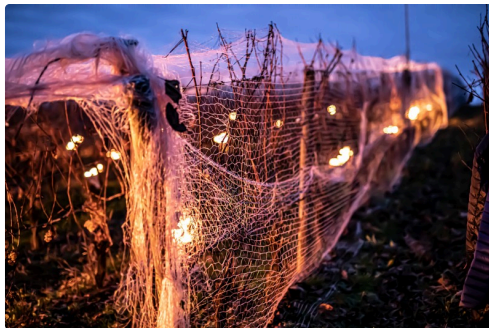
Les raisins sous filets protecteurs