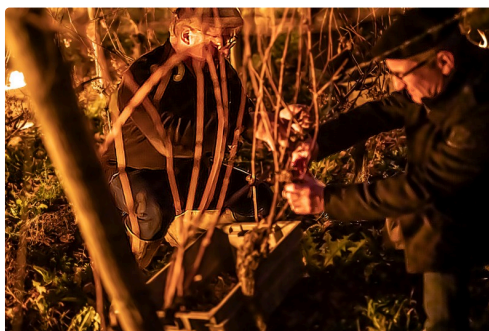
Cueilleurs au travail