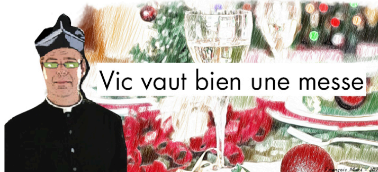
"Le petit monde de Vic", le retour avec "Vic vaut bien une messe" !