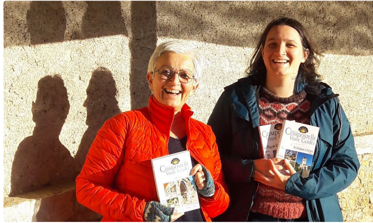
Un guide sur la mythique Via Podiensis, entre Cahors et Condom

Il vient de paraître aux éditions du Vieux Crayon