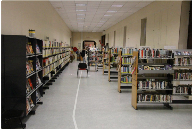
Le plaisir de lire et de partager : l'amour des livres et les livres sur l'amour

La Médiathèque Yves Navarre participe à la 6e édition des Nuits de la lecture