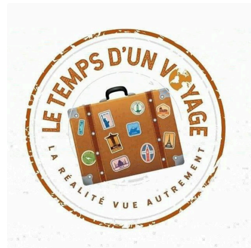
le temps d1voyage (002).jpg