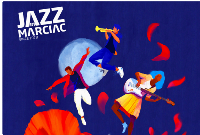
JIM lève le voile

Le festival Jazz in Marciac se profile à l'horizon