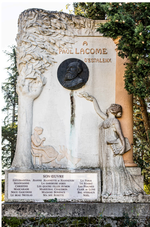
Monument actuel au Houga