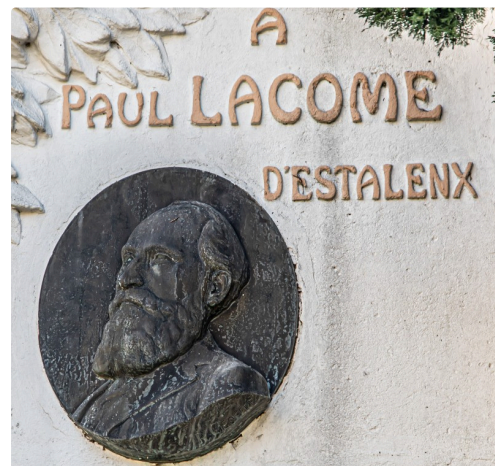
Gros plan sur le médaillon du monument actuel