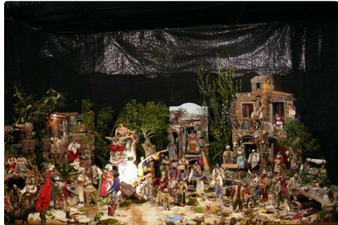
La crèche napolitaine était exposée au Noël dernier.

Et forts de leur première expérience de l'an passé, « les motivés » vont soigner le côté communication pour que Valence-sur-Baïse soit encore plus attractif pour les fêtes de Noël.* « La notoriété du village aura beaucoup à y gagner et nos restaurateurs devraient voir leurs tables occupées le temps des festivités. C'est là aussi un des buts visés », conclut Claude Laffargue.