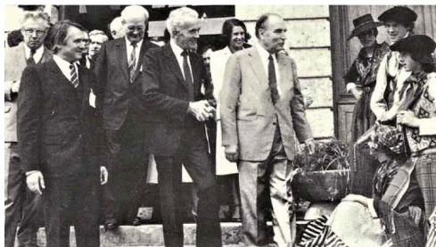
La venue du président Mitterrand en 1982 (carte postale).