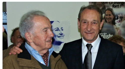
En 2007 avec la venue de Bertrand Delanoë.