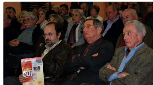
En 2005 meeting pour l'Europe.