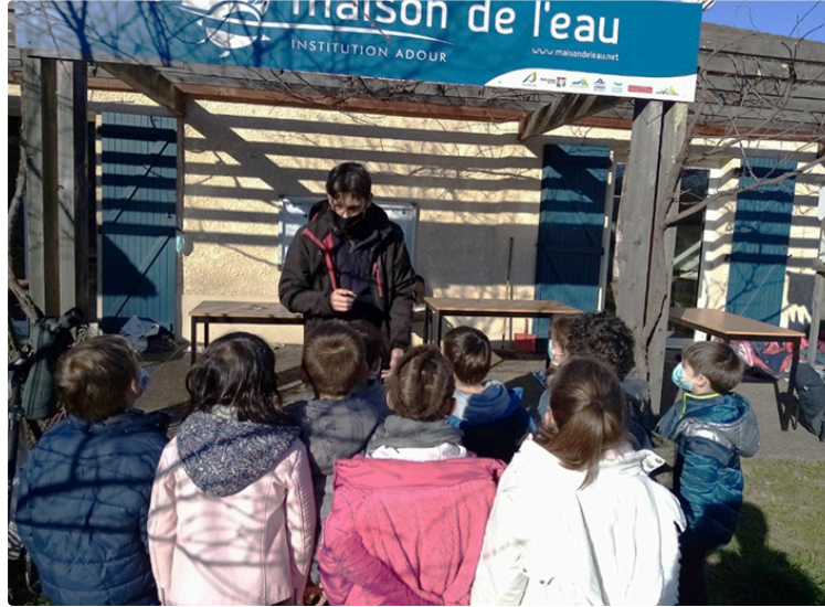
La Maison de l'Eau pour une découverte ludique de la Nature.

Les élèves de l'école primaire ont apprécié