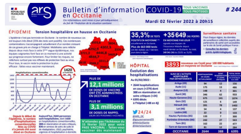
Bulletin info ARS Occitanie du 02 février 2022

L'épidémie n'est pas terminée en Occitanie : le nombre de nouveaux cas est toujours très élevé (35% des tests sont positifs). Ces nombreuses contaminations s'accompagnent actuellement d'un nombre croissant de cas graves pris en charge à l'hôpital. Mobilisées sans relâche depuis deux mois face à cette 5ème vague épidémique, nos équipes soignantes font face en ce moment à une activité qui progresse encore fortement. Pour limiter les risques, ne relâchons surtout pas nos réflexes de protection face au virus. Pour tous, le vaccin reste la protection la plus efficace : faites-vous vacciner maintenant.