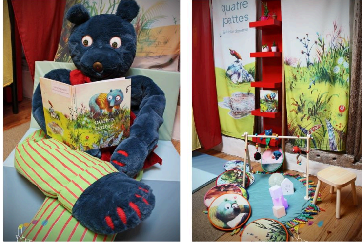
La médiathèque de Samatan informe