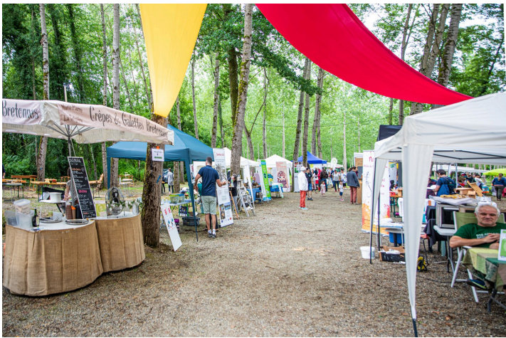
Une allée de l'écofête de 2021