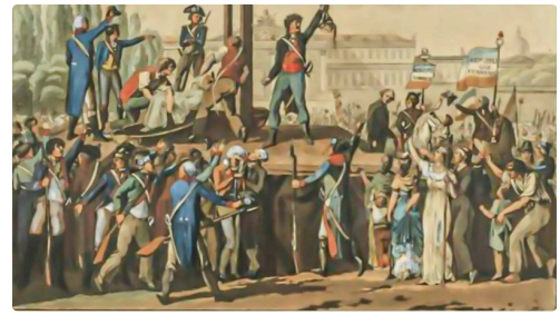
La guillotine