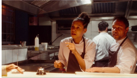
"The chef" au cinéma mardi soir