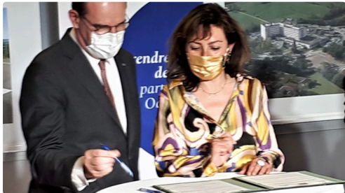
On signe le protocole.