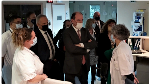
Aux urgences, réanimations.