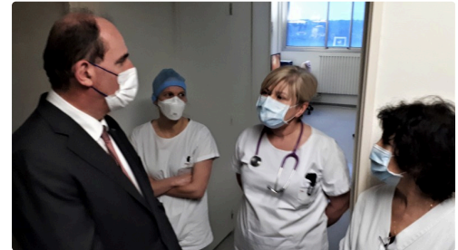
Chez les "covidés".