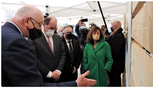
On se repère sur la carte.