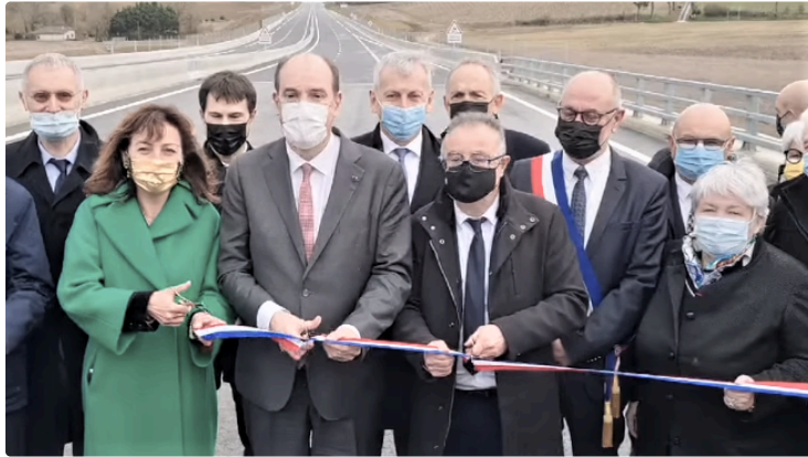
Comme promis le père Noël gersois est revenu sur ses terres la hotte pleine