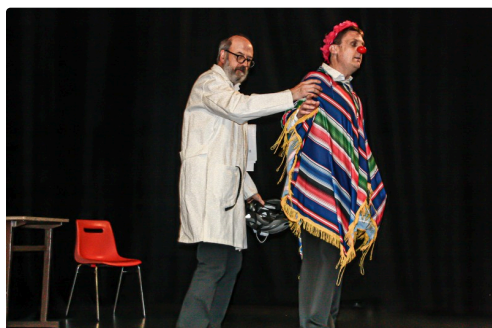
Scène de "Vous avez quel âge ?" (photo Jocelyne Sanson)

N.B. - Sur la photo du haut de page (communiquée par Jocelyne Sanson), une scène des "Petites bouffes culturelles" (Jésus revient).