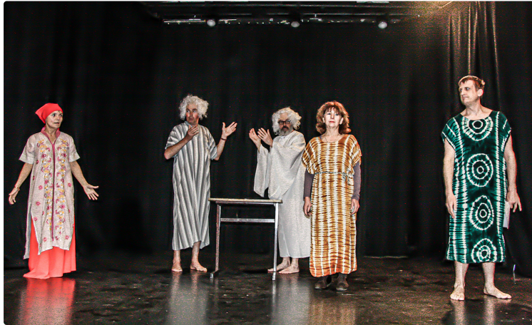
Spectacle du Clan le 27 février au cinéma-théâtre de Nogaro

Dimanche 27 septembre, le Centre social et culturel le Clan invite le public à passer une joyeuse après-midi au cinéma-théâtre de Nogaro. Le rire est de nouveau le propre des Gascons, puisque l'on entrevoit la fin de la pandémie.