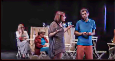
Scène de "Place de l'Horloge" (extrait d'une vidéo de Youtube)