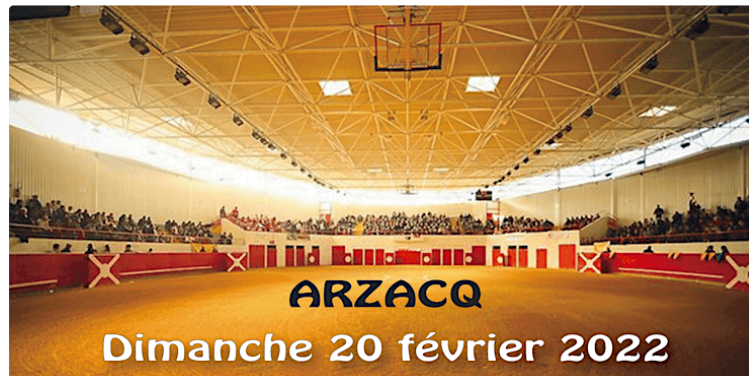
Ouverture de la temporada à Arzacq

C'est à Arzacq ( Béarn) que les aficionados vont retrouver leur premier paseo et voir défiler sur le sable les jeunes toreros de la novillada non piquée organisée dans les arènes couvertes du "Soubestre".