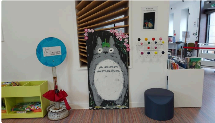
La médiathèque a tenu le cap en 2021 malgré le contexte !

Et l'année 2022 s'annonce bien remplie et pleine de promesses !