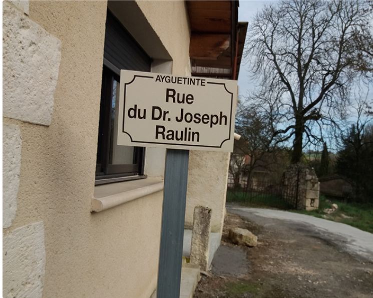
Petit village, petite rue, pour un grand Monsieur

Ayguetinte n'a pas oublié l'enfant du pays.