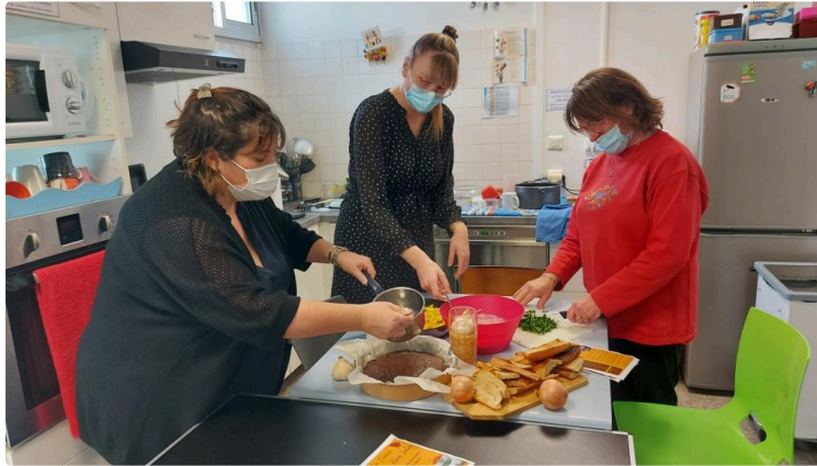
Direction le Taj Mahal avec Vic Accueil !

Quand nous pénétrons dans les locaux de Vic Accueil, une alléchante odeur nous chatouille les narines et nous conduit tout droit vers la cuisine !