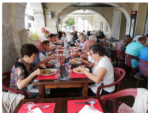
Sous les arcades, il y avait toujours du monde.