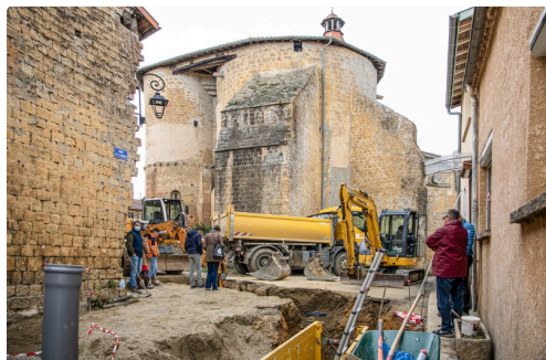
Le chantier vue de la rue de la Rampe

N.B. - Sur la photo du haut de page : Valérie Salle photographie l'état des travaux.