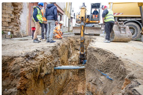
Un passage est frayé à côté du mur découvert