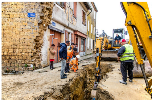
Les travaux dégagent un passage pour les canalisations