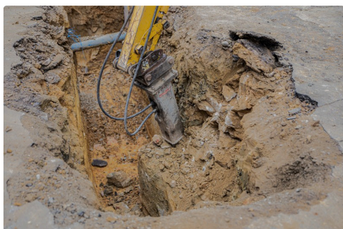
Le pan du mur écorné pour frayer un passage