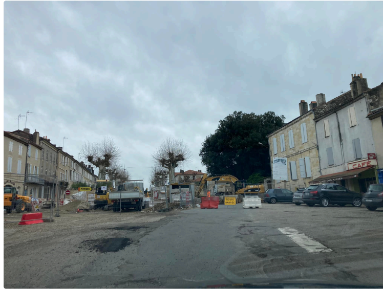
Travaux ; C'est parti et bien parti